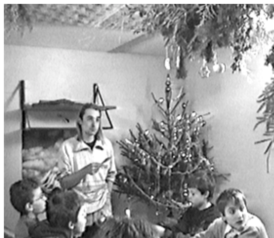
Vánoční besídka 1999.

Druhý den už od rána přelo a bylo poměrně teplo takže bylo jasné, že lyže necháme v autobusu definitivně. Dětský oddíl si to namířil směrem na Nové město k biatlonové střílnici. U ní se nachází dvě jezírka, které spojuje dlouhý vodopád tekoucí v jakémsi umělém korytě. Zajíc samozřejmě hned začal uvažovat jak by se dal jet, ale došel k závěru, že by ho sjel snad jenom cvok.