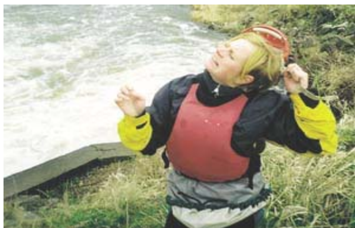
Irčo, co se tak křeníš?