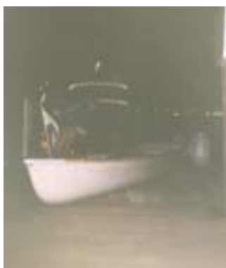
Hamburk – v pozadí je osvětlený parník