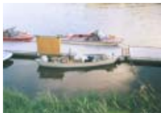
Kotvíme, jdu pro vodu

Před námi je Geesthacht, místo, kde je na Labi jediný jez na celém německém území. Plavební komory jsou však na druhém břehu než jedeme. Labe je zde dobrých 500metrů široké. Děláme traverz, voda nám však cáká do lodi. Když přistaneme, musíme ji