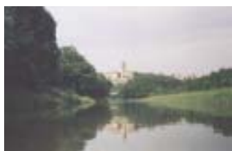
Vltava se vlévá do Labe

První dva pražské jezy přetahujeme v jednom místě.