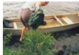
Vlny nám cákají do lodě

vylít. Já se jdu podívat na zdymadlo. Je velké tak pro šest remorkérů. Těch tu jezdí mnoho a jsou plně naložené. Voda jim cáká až na samý okraj nákladového prostoru. Hodně jich je českých. Po obědě a osušení věcí přijíždíme k velkým vratům. Čekáme, až se komora napustí. Přijíždí si nás prohlédnout člun policie. Ptám se jich, zda můžeme s naší malou lodičkou vjet dovnitř. Radiem se spojují s věží a pak říkají, že můžeme jet. Komora je vskutku veliká. Z vedlejší lodi na nás volají, že bychom se měli u okraje komory přivázat. Činíme tak, ale máme z toho legraci. Jak voda klesá, střídáme úvazy. Vrata se pomalu otevírají a před námi je volná cesta do Hamburgu.